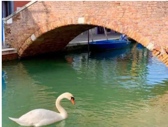
Мал.2. Наслідки карантину у Венеції (Італія).